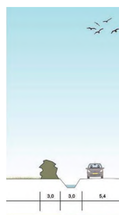
2. Haag en watergang omdraaien