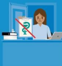
Zorgverzekeraar wil zorgverzekering opzeggen