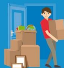
Ontruiming van woning door verhuurder