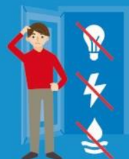
Afsluiting levering gas, electra of water