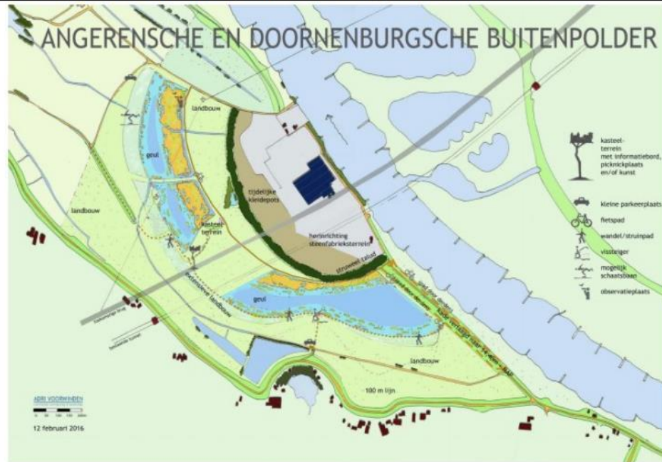
Figuur 15 Inrichtingsplan natuurversterking t.b.v. de herinrichting steenfabrieksterrein

De provincie Gelderland is akkoord gegaan met deze natuurversterkingsmaatregelen. Gezien het feit dat de beoogde windturbines binnen het uitbreidingsdeel van het fabrieksterrein zijn gelegen is de natuurversterking van GO reeds geborgd. De voorgenomen plannen zijn derhalve in te passen binnen de Groene Ontwikkelingszone. De windturbines worden buiten de provinciaal aangewezen weidevogelgebieden en rustgebieden voor winterganzen gesitueerd, inclusief overdraai.”