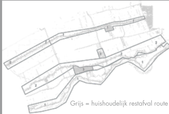
Grijs = huishoudelijk restafval route

Kern Lopik (excl. Dorpstraat) Bedrijventerrein