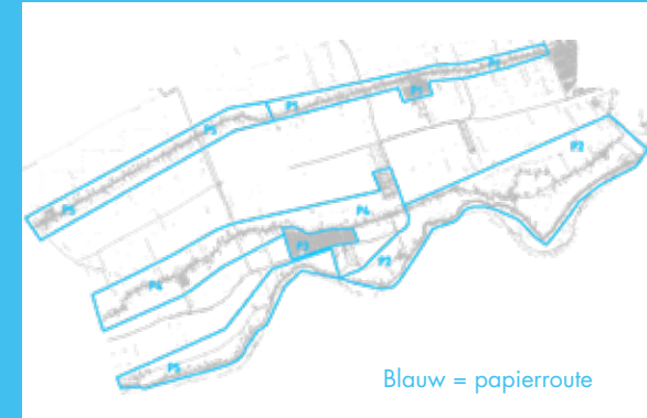
Blauw = papierroute

p5 Donderdagavond Polsbroek/Benschop tot Adriaan van Vlietbrug, Lekdijk West, Willige Langerak