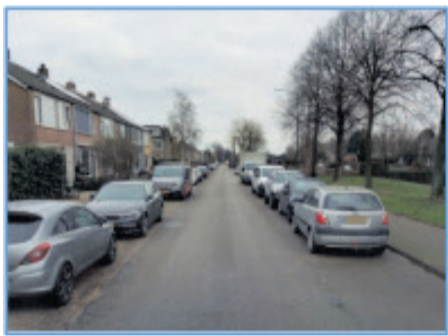
Bestaande situatie Europasingel

In het schetsontwerp nemen we de opgehaalde