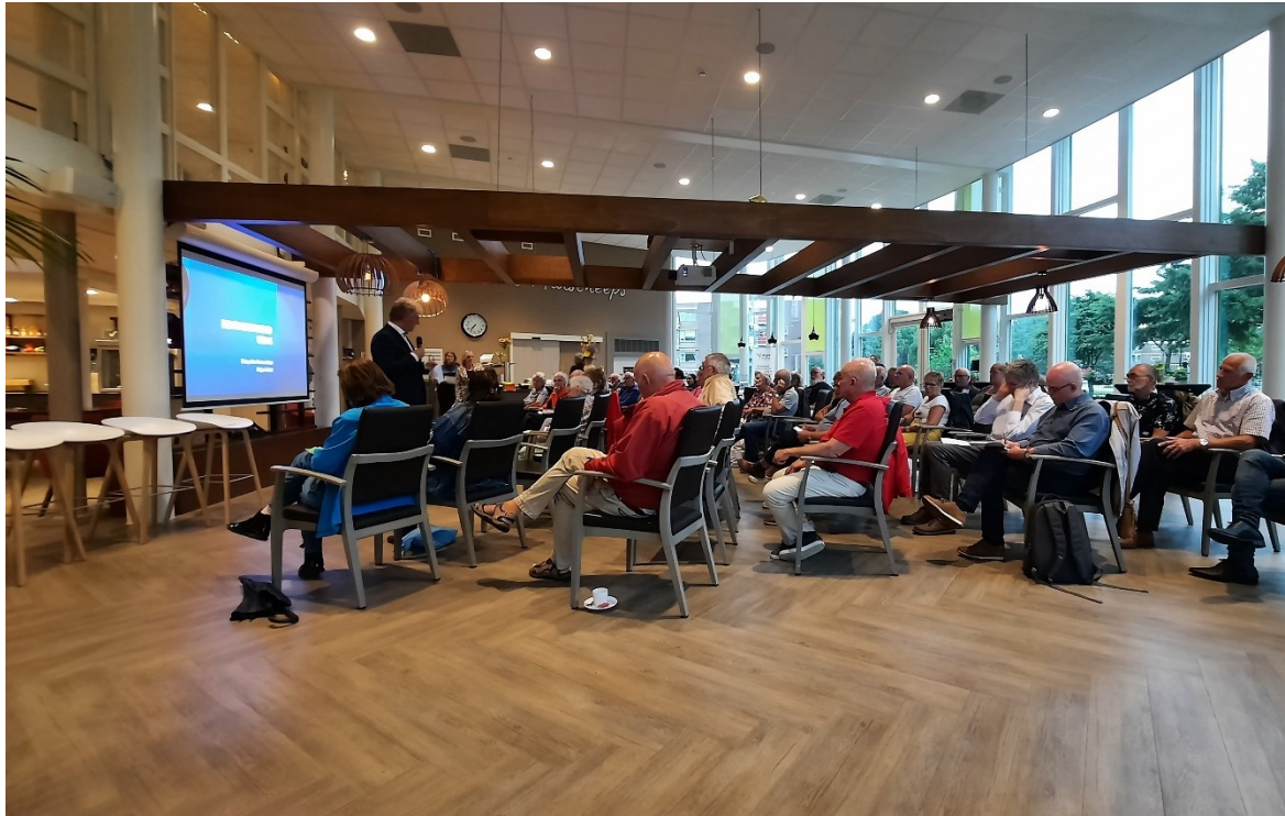
Bewonersavond Veilig Sluispolder 30 juni 2022