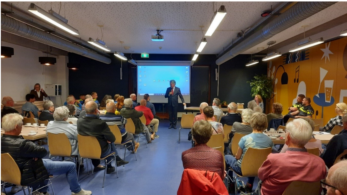
Bewonersavond Veiligheid Kapelpolder 13 oktober 2022