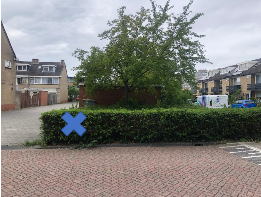
XC53 Lepelaarplantsoen ter hoogte van nummer 53 Container(s) restafval