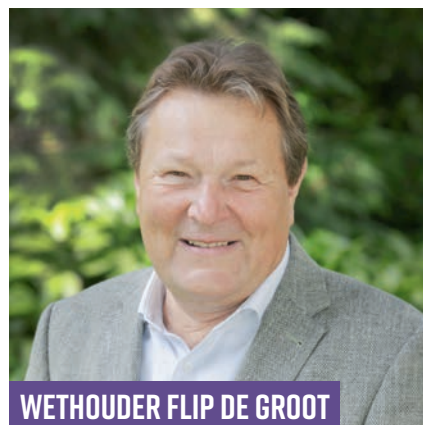
WETHOUDER FLIP DE GROOT GEMEENTE LAREN