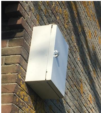
Afbeelding trillingsmeter in een beschermkast