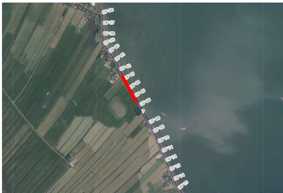
Figuur 1: Locatie afgraven bestaande dijk