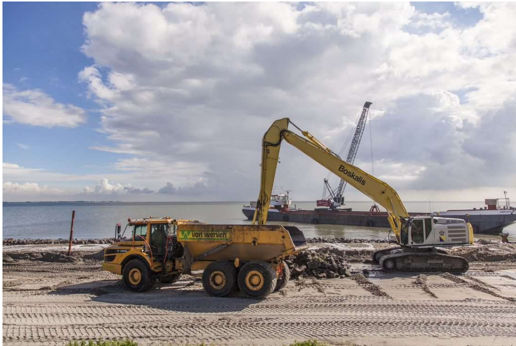
Afbeelding 1: Aanbrengen van zand d.m.v. een dumper en kraan