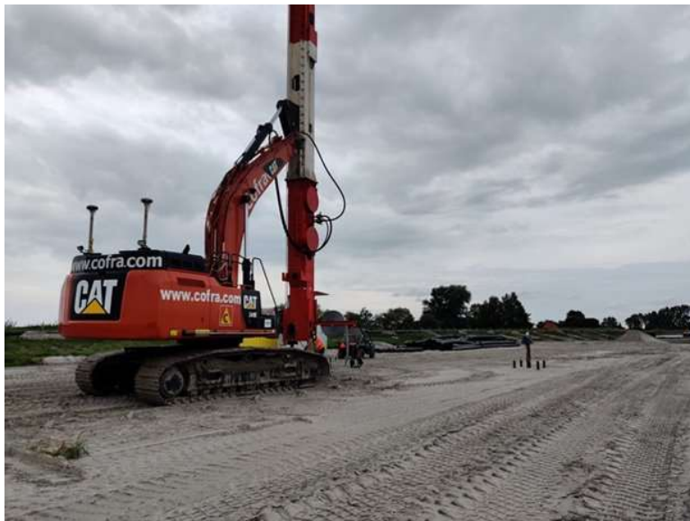
Afbeelding 2: Kraanopstelling voor aanbrengen verticale drainage

Om het overspannen water sneller uit de grond te krijgen, maken we gebruik van verticale drainage. Deze drainage bestaat uit een strip die verticaal de grond in wordt gebracht. Het water wordt dan door de overdruk aan waterspanning omhoog gebracht. Hierdoor wordt de waterspanning verlaagd en komt die dus sneller weer op het gewenste niveau. Op sommige plaatsen wordt door middel van vacuumbemaling het water uit de verticale drainage gepompt. Hierdoor kan de grond haar overspanning nog sneller kwijtraken. In afbeelding 2 is het aanbrengen van de verticale drainage door een kraanopstelling weergegeven.