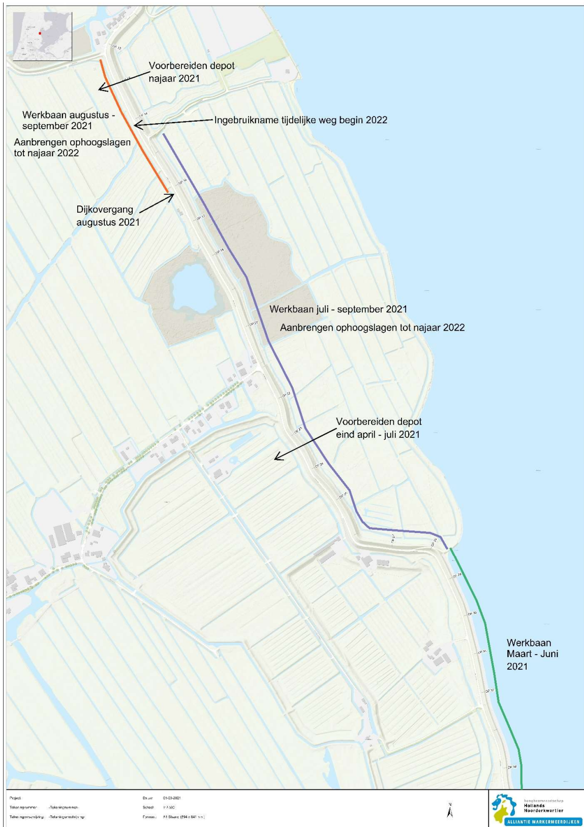
Kaart 1: Overzicht werkzaamheden Module 5