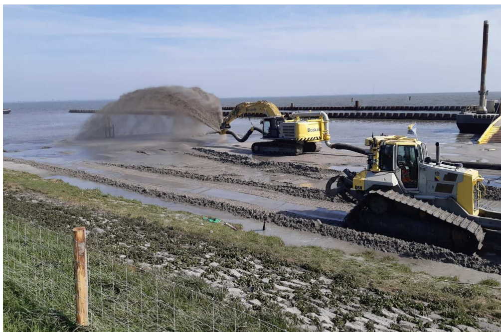
Afbeelding 1: 'rainbowen' ter hoogte van aanlandingsplaats loswal 4

In deze fase worden er nog geen werkzaamheden aan de dijk zelf verricht. Er wordt nog niet gegraven in de bestaande dijk, ook blijft de steenbekleding op het talud van de dijk nog intact. Wel wordt een deel van de kreukelberm tot 1,5 van het teenschot, dit zijn de stenen in het water, 'opgedraaid', waarbij een deel van de stenen opgegraven worden en tijdelijk tegen het talud van de dijk aan gelegd worden. Een schematische weergave van het realiseren van de transportbaan is weergegeven in afbeelding 2.