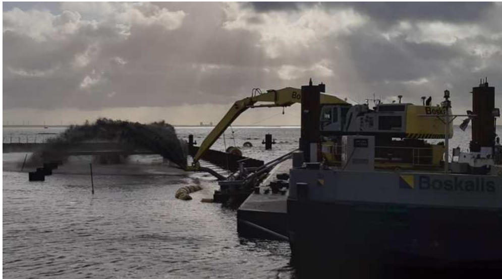
Afbeelding 3: 'rainbowen' bij loswal 4

Nu de damwandconstructie af is, wordt deze laag voor laag gevuld met zand door een kraan met sproeier (zie afbeelding 3). Met deze techniek wordt ook de aansluiting van de dijk naar de loswal gemaakt. De loswal is begin 2021 gereed voor gebruik.