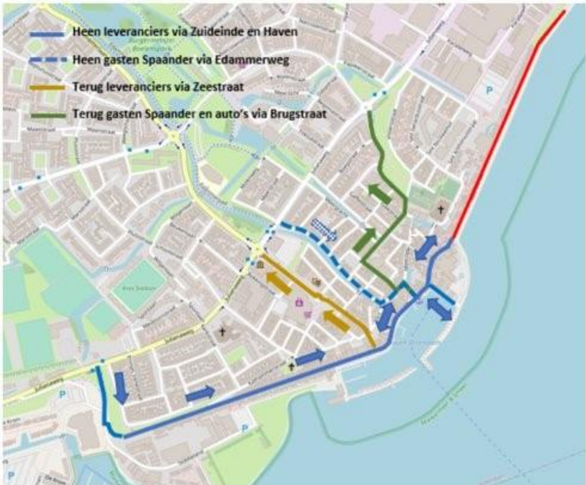
Omlidingsroute autoverkeer van maandag 16 oktober 7.00 uur t/m donderdag 19 oktober 17.00 uur en vanaf maandag 23 oktober 2023 – kerstvakantie 2023 tijdens werkdagen van 7.00 - 17.00 uur.