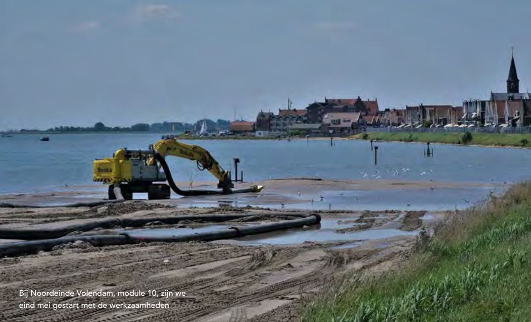
Bij Noordeinde Volendam, module 10, zijn we eind mei gestart met de werkzaamheden