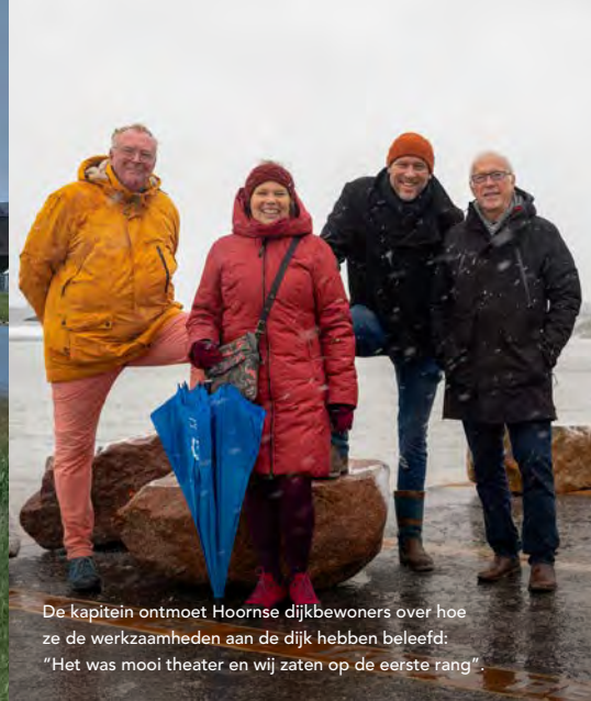
De kapitein ontmoet Hoornse dijkbewoners over hoe ze de werkzaamheden aan de dijk hebben beleefd: "Het was mooi theater en wij zaten op de eerste rang".