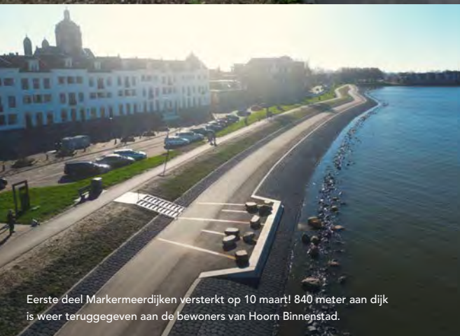
Eerste deel Markermeerdijken versterkt op 10 maart! 840 meter aan dijk is weer teruggegeven aan de bewoners van Hoorn Binnenstad.