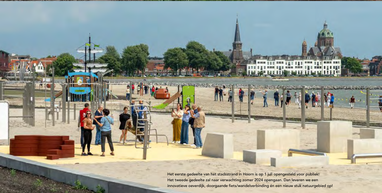
Het eerste gedeelte van het stadsstrand in Hoorn is op 1 juli opengesteld voor publiek! Het tweede gedeelte zal naar verwachting zomer 2024 opengaan. Dan leveren we een innovatieve oeverdijk, doorgaande fiets/wandelverbinding én een nieuw stuk natuurgebied op!