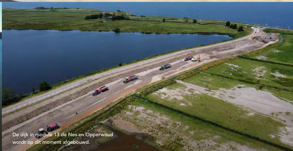
De dijk in module 13 de Nes en Opperwoud wordt op dit moment afgebouwd.