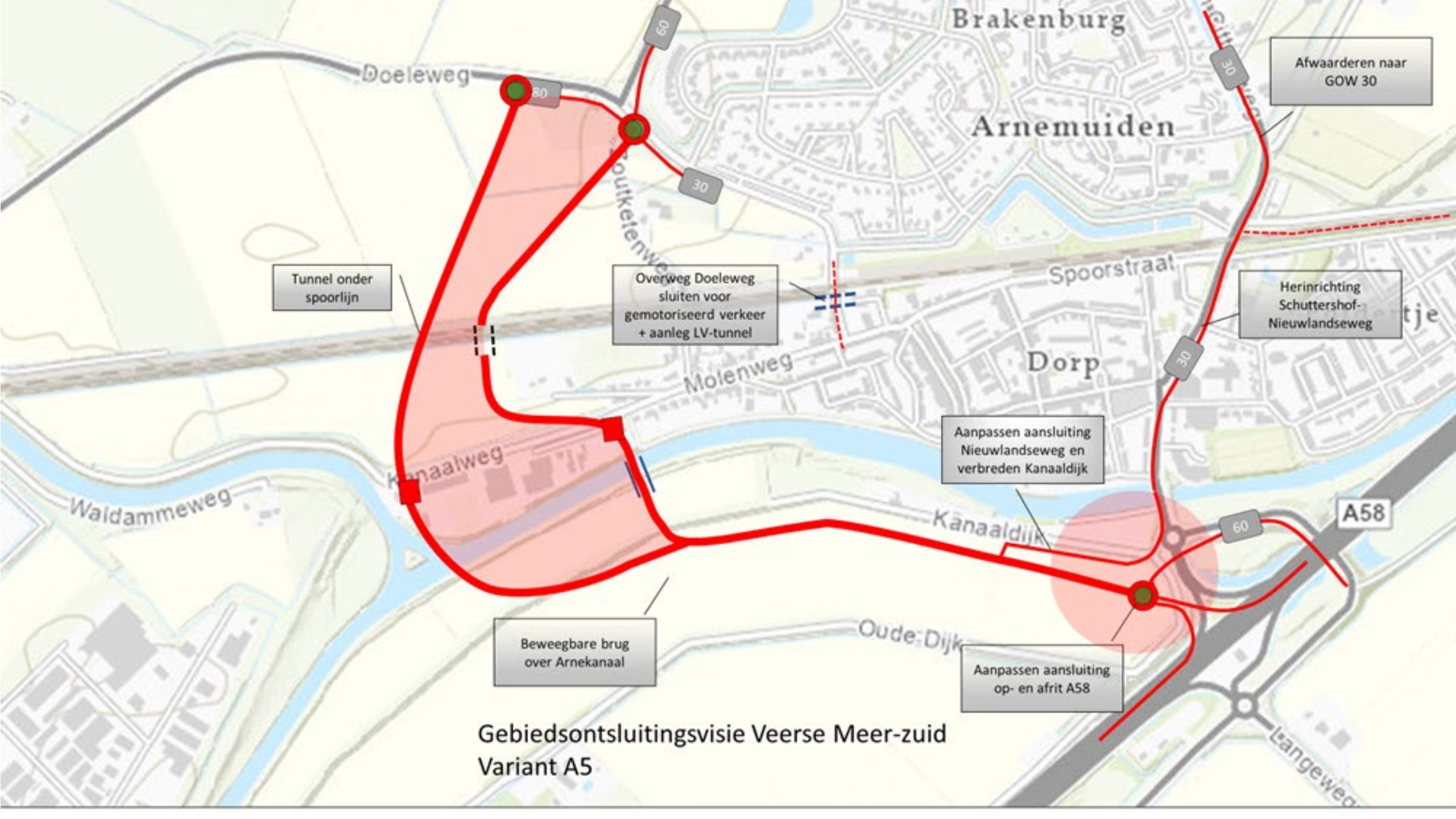
Gebiedsontsluitingsvisie Veerse Meer-zuid Variant A5