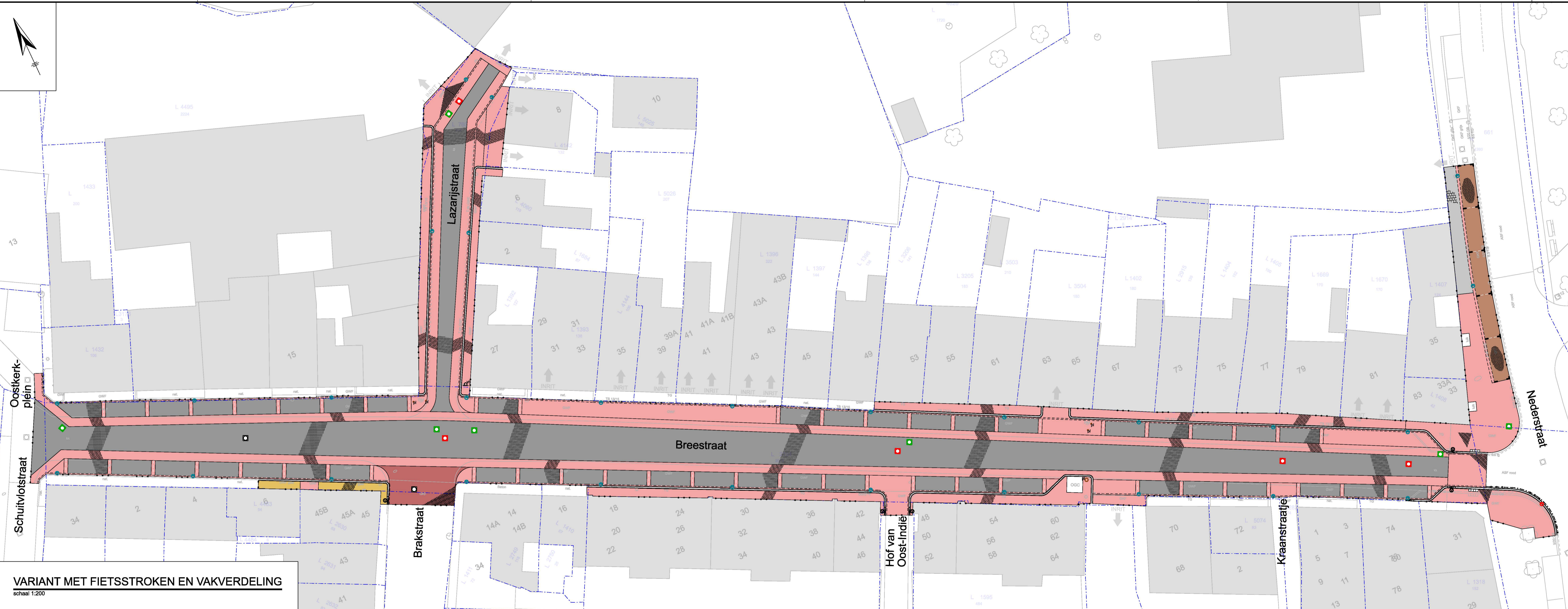
VARIANT MET FIETSSTROKEN EN VAKVERDELING schaal 1:200