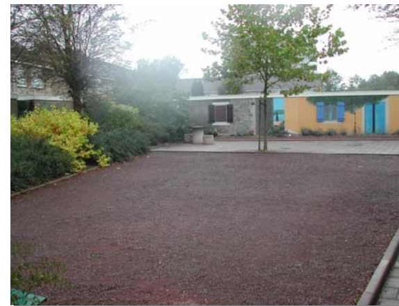
Jeu de boules (ouderen)

Gemeente Middelburg Dienst Ruimte Afdeling Ingenieursbureau Augustus 2006