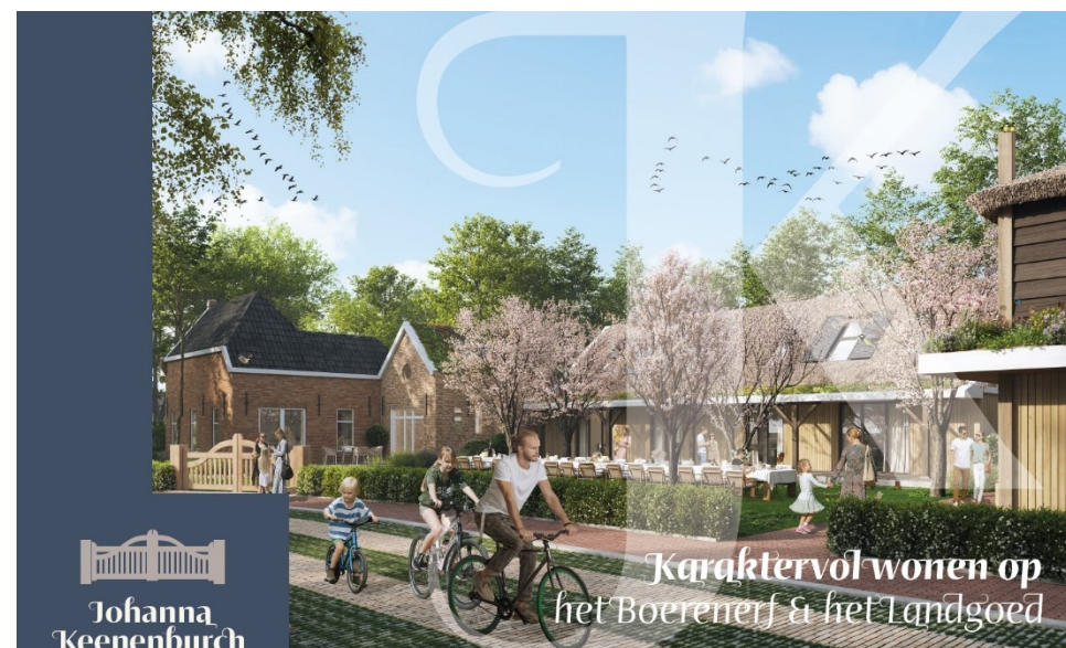
Figuur 1 Schetsontwerp Deelgebied 1: Zicht op het erf van het boeren erf