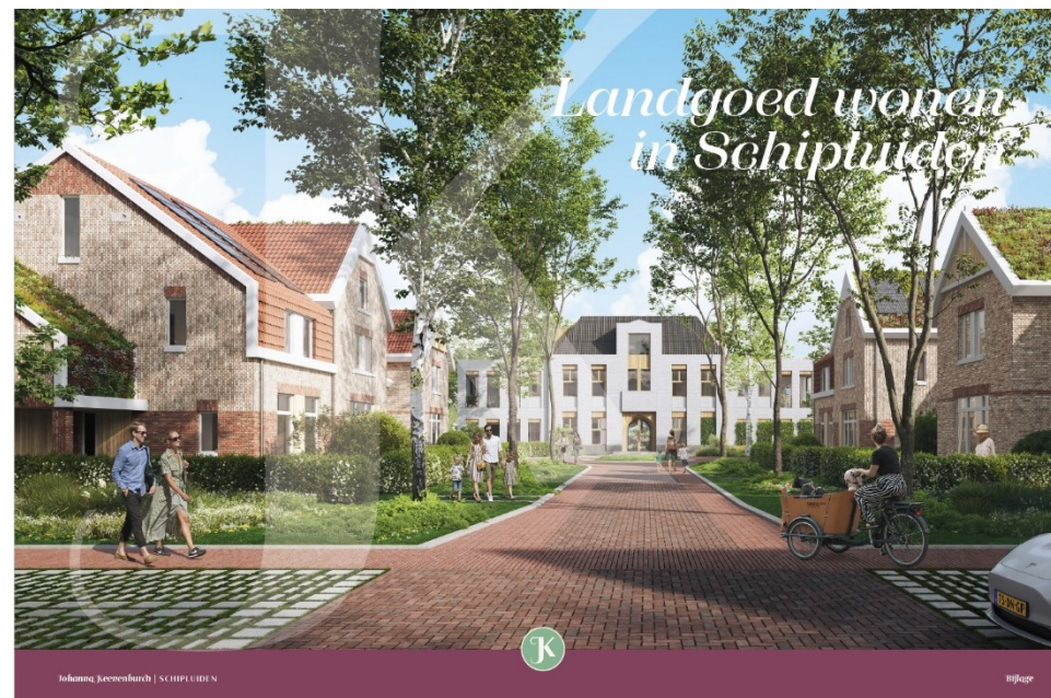
Figuur 3 Schetsontwerp deelgebied 3 en 4 met zicht op het drielaagse appartementengebouw

EFY Group heeft een helder en realistisch plan van aanpak gemaakt. Zij zullen veel aandacht besteden aan het informeren van omwonenden en belanghebbenden. Ook zet EFY Group zich in voor de toekomstige bewoners door onder andere een energiecoach aan te bieden. Samen met de duurzame keuzes in het ontwerp en duurzame manier van bouwen, leidt dit tot energiebewust wonen.