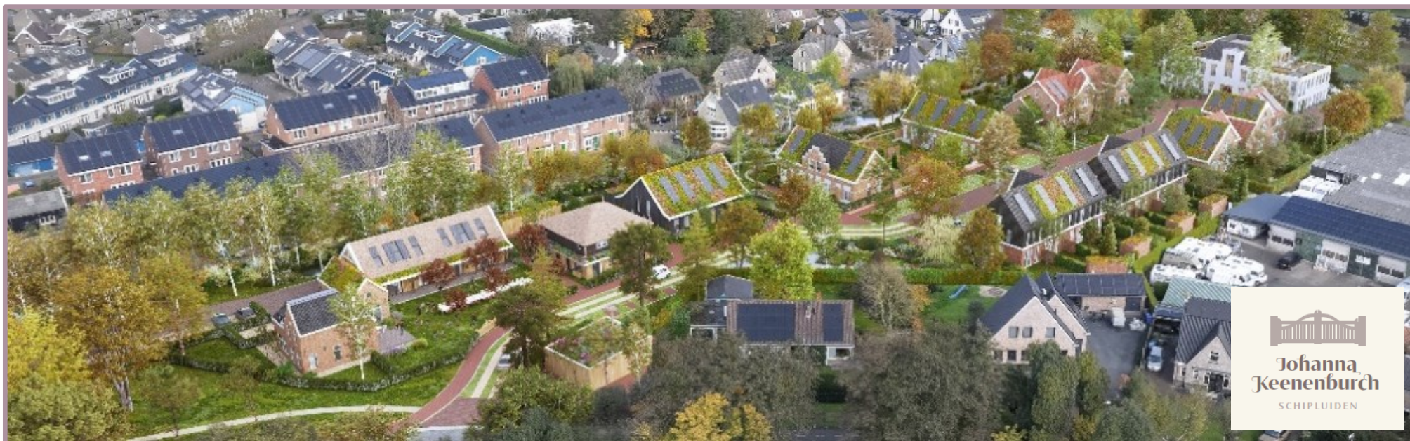
Figuur 4 (links) Natuur inclusief bouwen in het Schetsontwerp: Nestkasten en verblijven voor dieren Figuur 5 (onder) Vogelvlucht uit het Schetsontwerp Johanna Keenenburg van EFY Group

Lees meer op de gemeentelijke website > www.middendelfland.nl/nieuwbouwprojecten