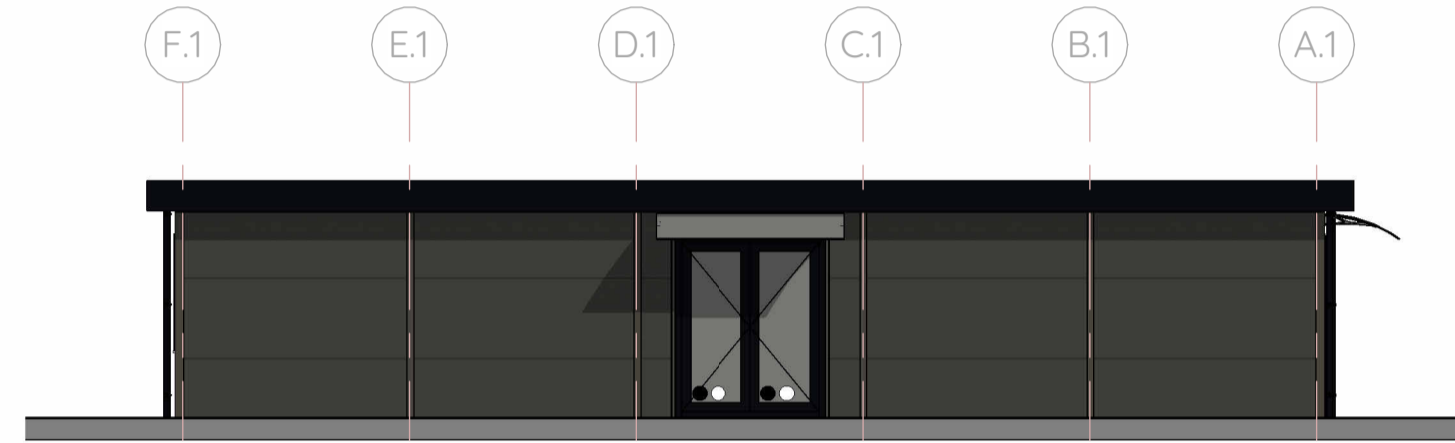
Linkerzijgevel gebouw 1 1:100