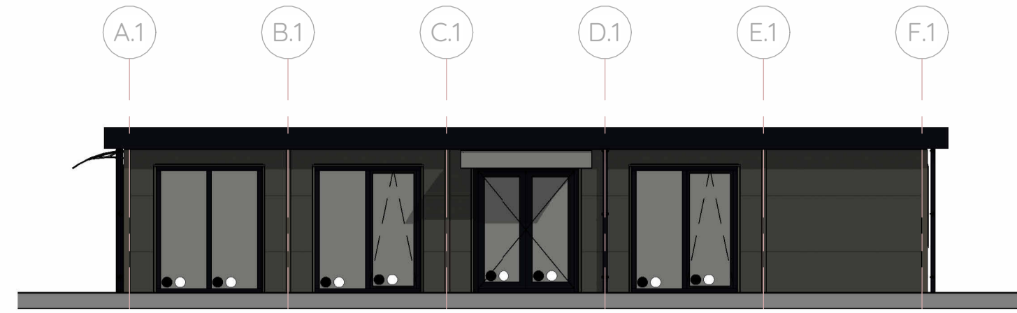
Rechterzijgevel gebouw 1 1:100