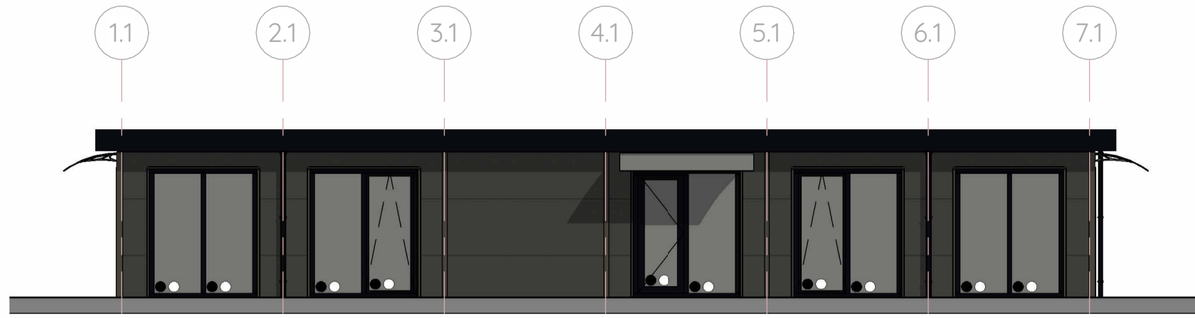
Voorgevel gebouw 1 1:100