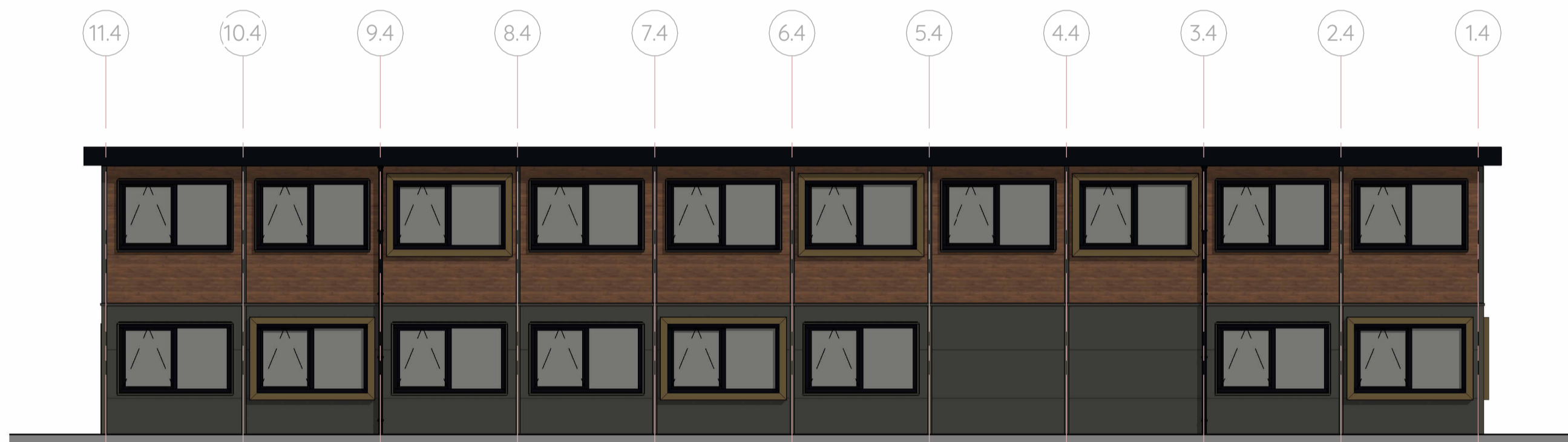
Achtergevel gebouw 4