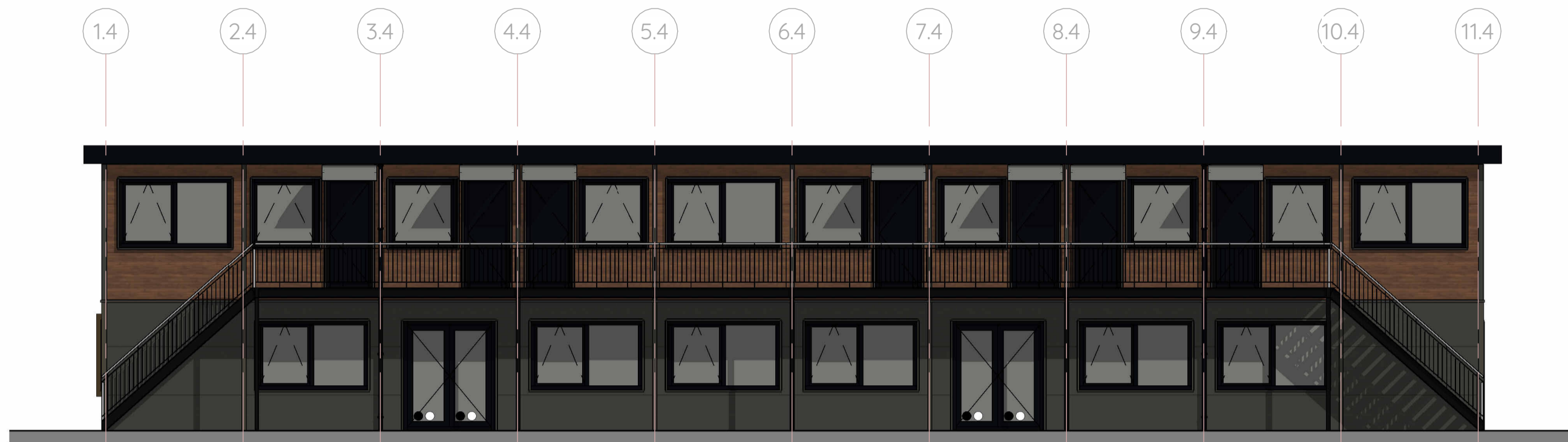
Voorgevel gebouw 4