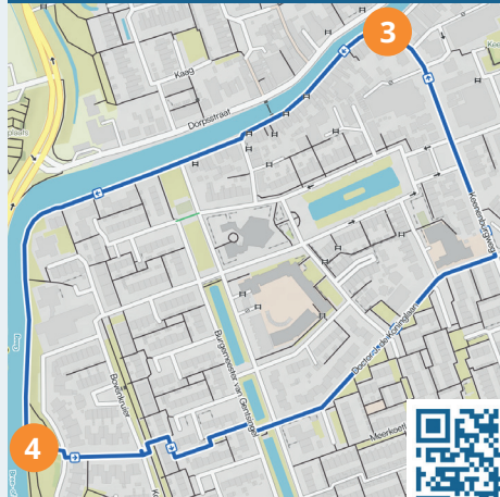
Het ommetje in Schipluiden