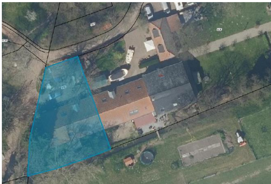
Afb. 2. Kadastraal Perceel Klein Huis te Velde 3a (blauw aangegeven).