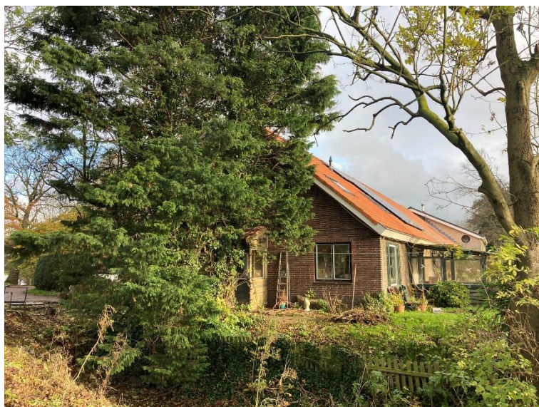
Afb. 6. Westelijke kopgevel en zuidelijke zijgevel.