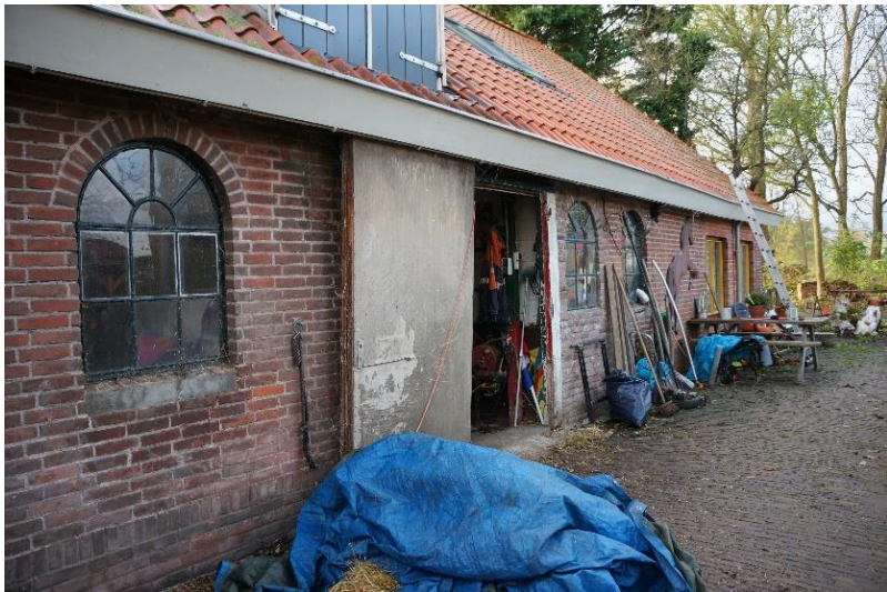
Afb. 7. Noordelijke zijgevel met boogvormig stalvenster.