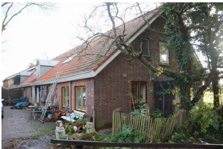
Afb. 5. Staldeel met woning. Westelijke kopgevel en noordelijke zijgevel.