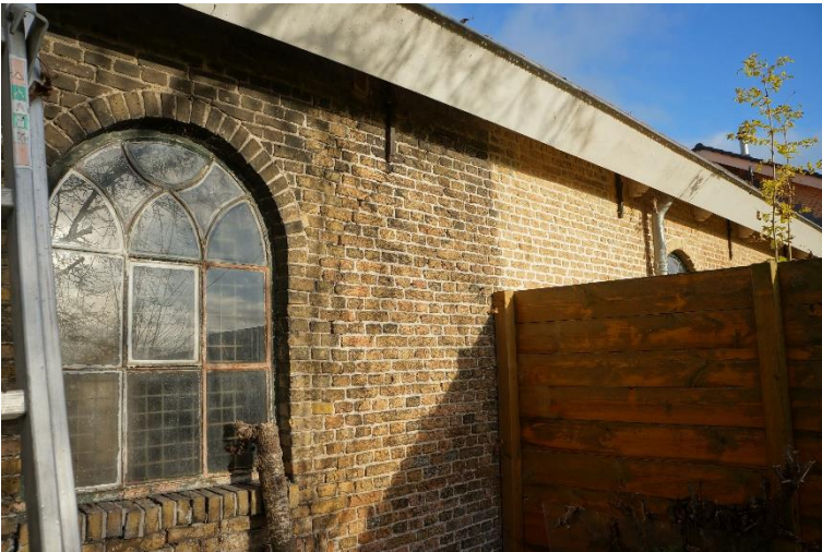
Afb. 10. Oorspronkelijk boogvormig stalraam met spitsboogvormige tracering.