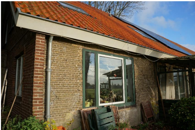
Afb. 8. Zuidelijke zijgevel (westdeel) in IJsselstenen en gecementeerde plint. Nieuwe gevelopeningen.