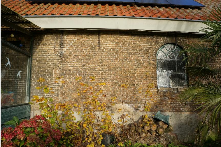
Afb. 9. Zuidelijke zijgevel (oostdeel) met oorspronkelijk metselwerk, vertanding in het metselwerk, gecementeerde plint, muurankers. Rechts een boogvenster met spitsboogvormige tracering.