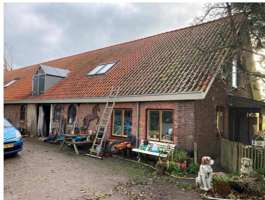
Afb. 1. Klein Huis te Velde 3a Maasland.

De redengevende beschrijving van Klein huis te Velde 3a is opgesteld op basis van bureauonderzoek, een gesprek met de gemeente Midden-Delfland en een locatiebezoek op 23 november 2021 door Dorp, Stad en Land.