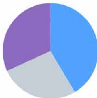
In welk dorp woont u?

De vragenlijst is 557 keer volledig ingevuld. Daarnaast zijn 249 vragenlijsten gedeeltelijk ingevuld. Het totaal aantal respondenten komt daarmee op 806. In de diagrammen hieronder meer informatie over de demografische kenmerken van de respondenten.