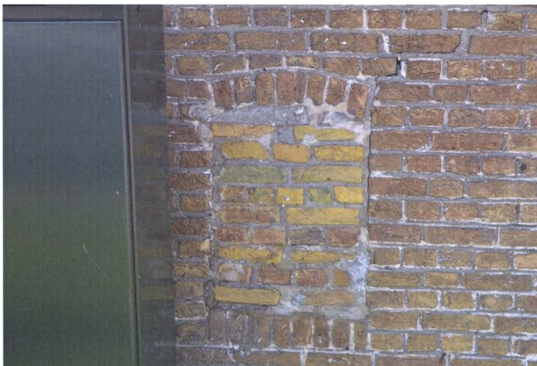
Dichtgemetselde vensteropening rechter zijgevel.