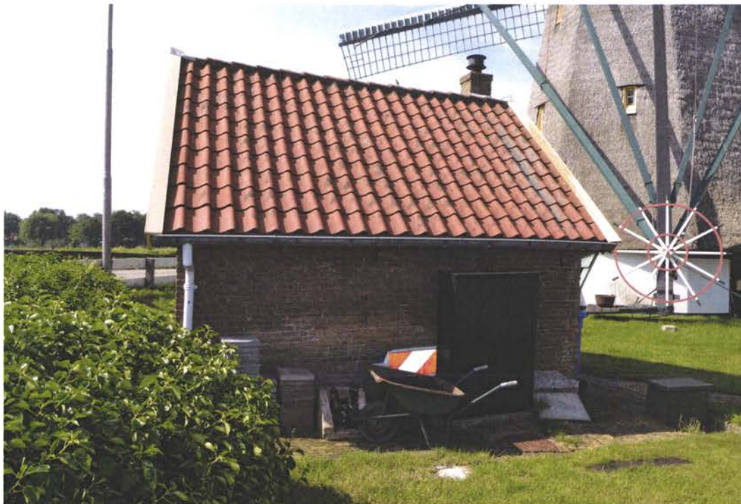
Overzichtsfoto rechter zijgevel, achter in beeld de Dijkmolen.