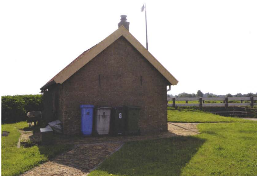
Overzichtsfoto achtergevel.