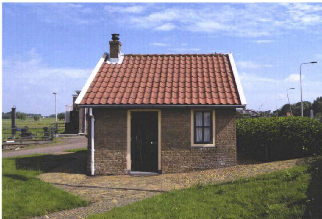
Overzichtsfoto linker zijgevel.