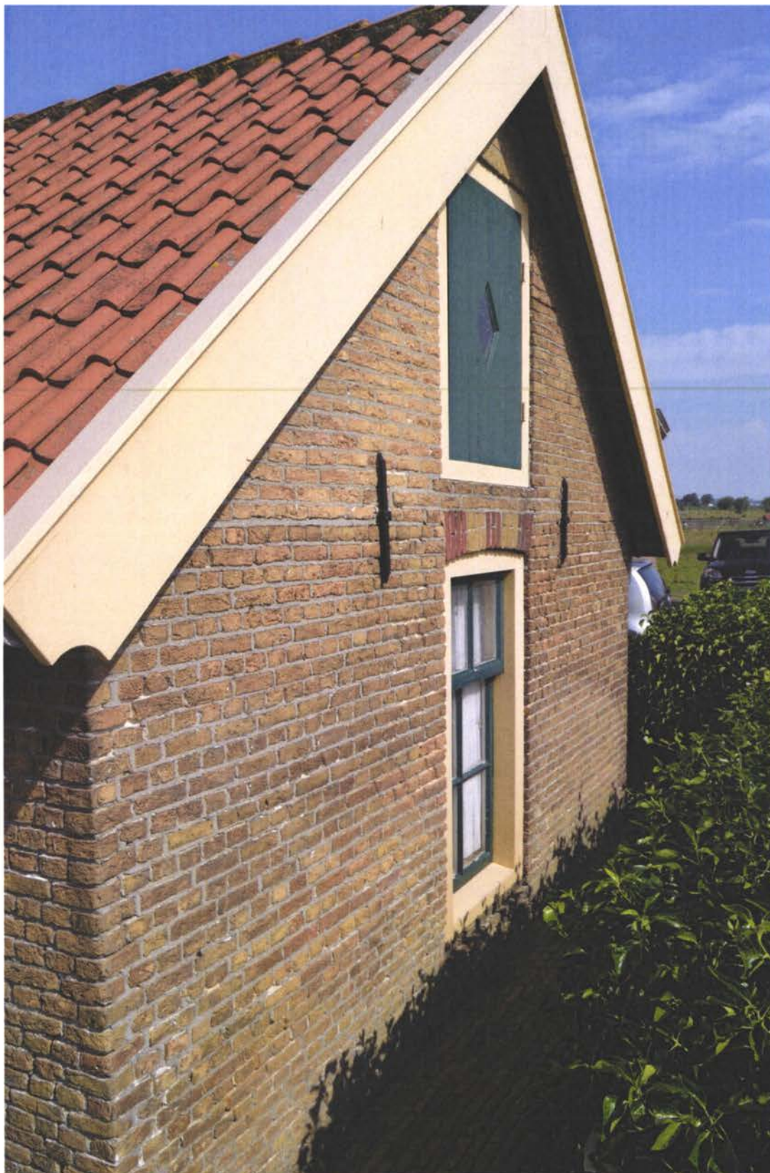
Zijaanzicht voorgevel.