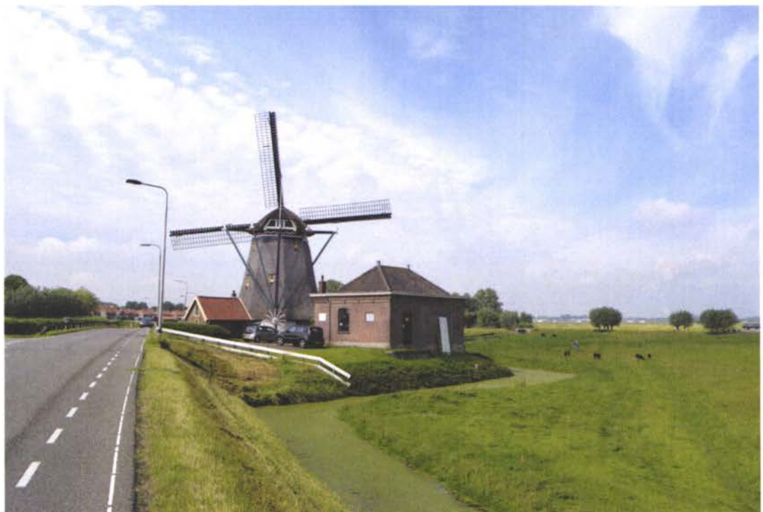
Overzichtsfoto van het complex met gemaal in de voorgrond.