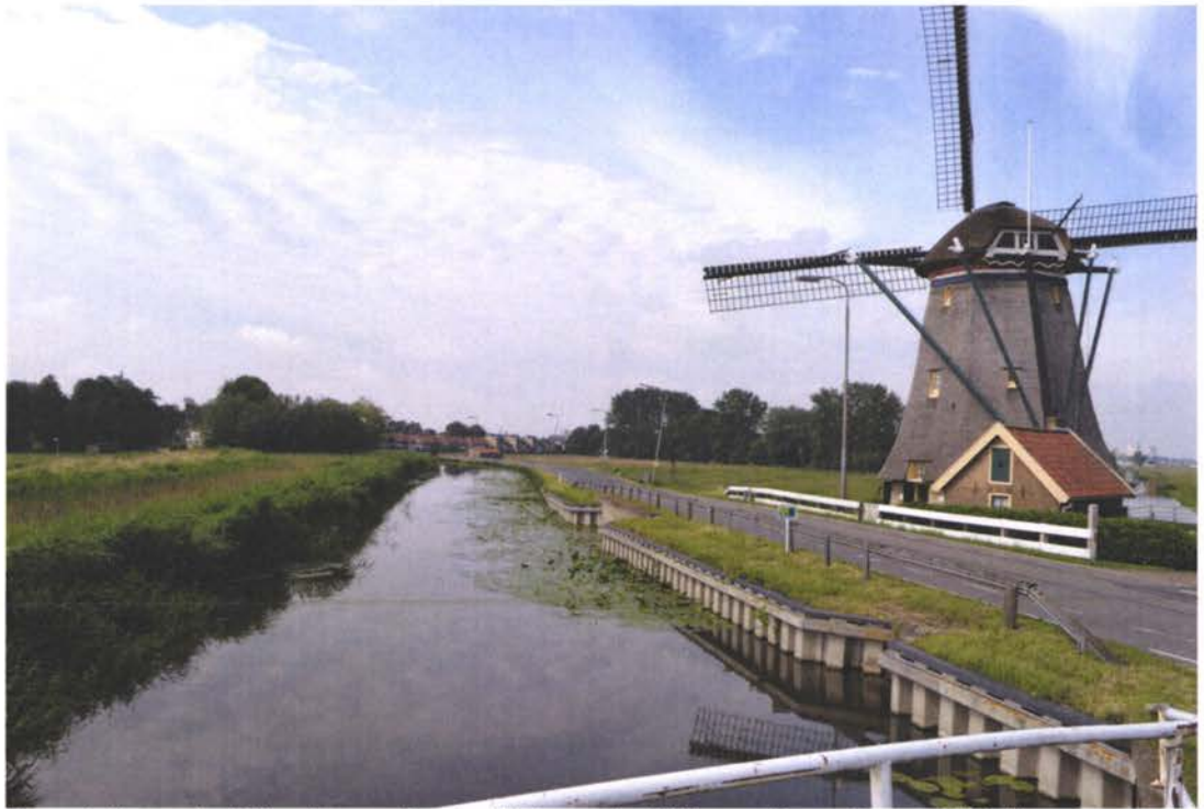
Zomerhuis van de Dijkmolen, onder de dijk langs de Zuidgaag.