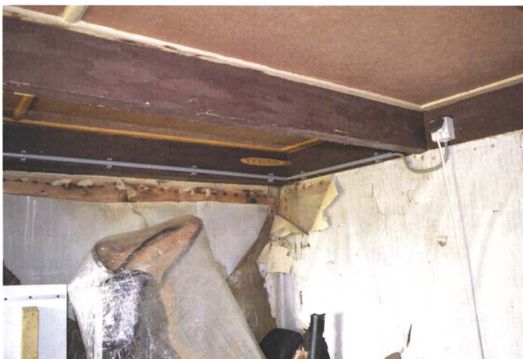
Enkelvoudige balklaag en veer muuranker.