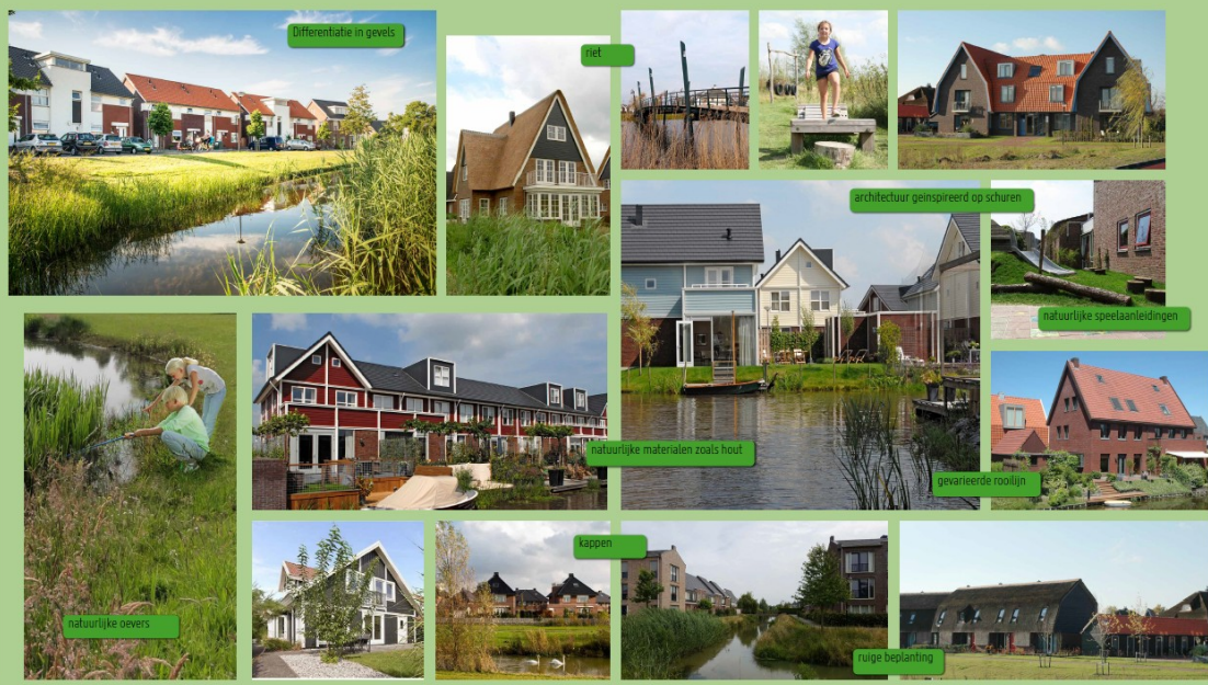
De Kreekzone Den Hoorn participatiesessie 6 september 2016