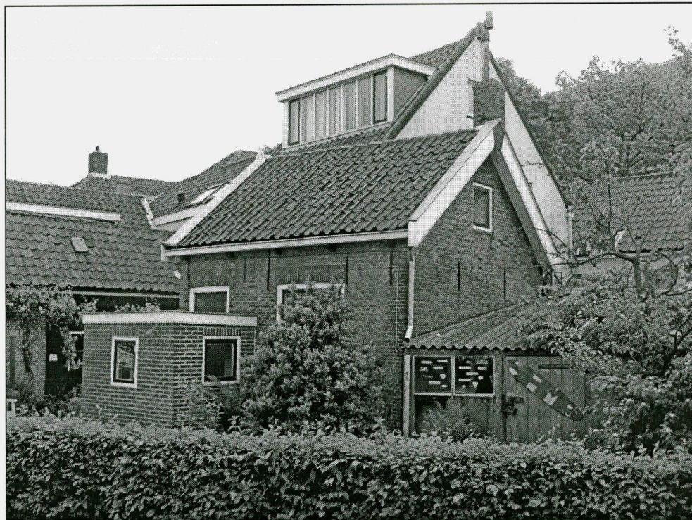
Voorgevel en zijgevel met (rechts) aangebouwde schuur.