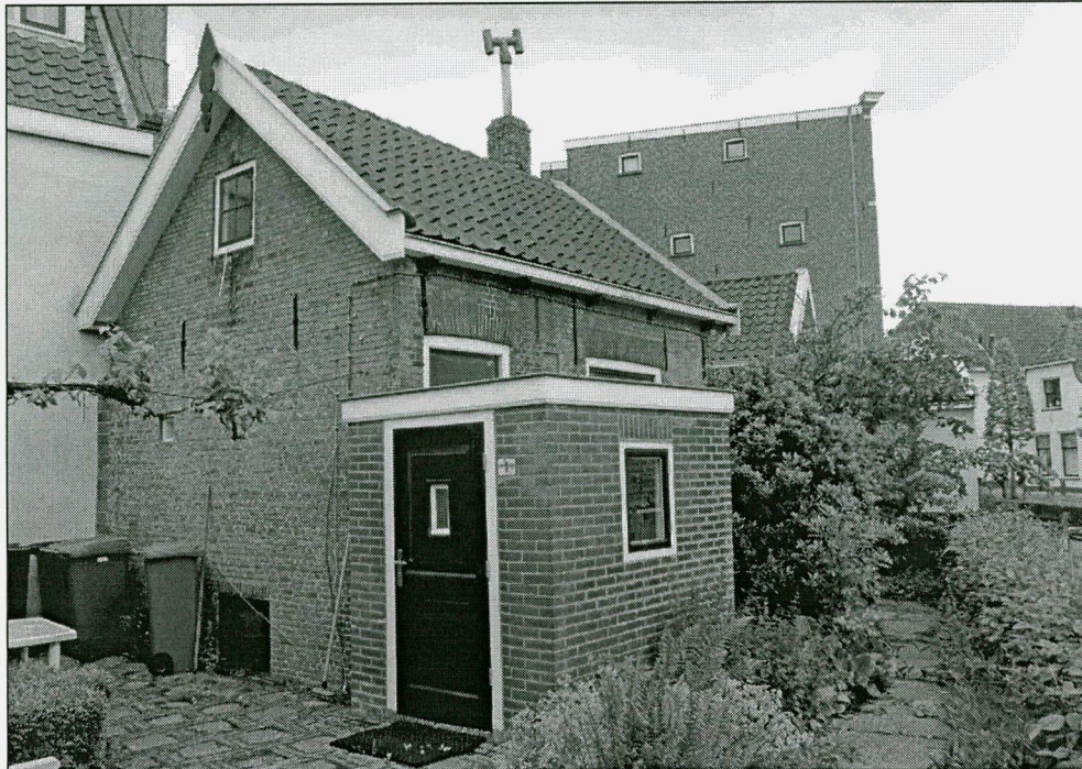
Zijgevel en voorgevel met aangebouwd portaal.