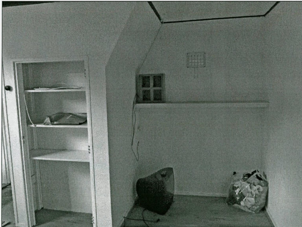
Wand met rechts de plaats van vroegere bedstee. Voorheen was hier een keldertje onder de bedstee.