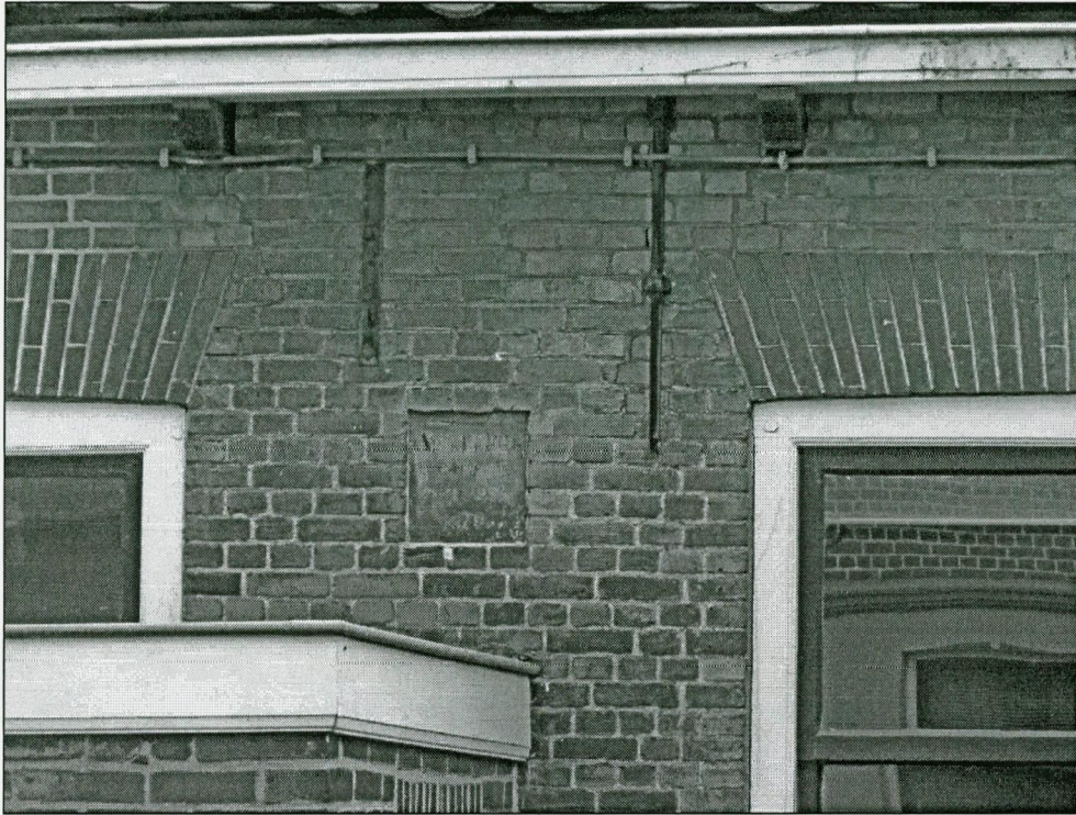
Gevelsteen tussen het bovenlicht van de vroegere deur en het woonkamerraam.