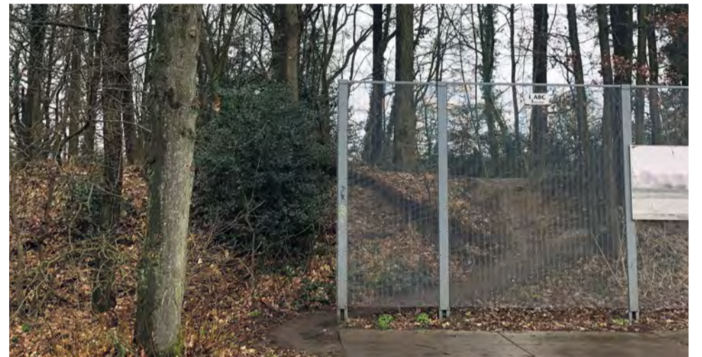
Ingang Patersbosje vanaf het station.

Al jarenlang gebruiken Molenhoekers het Patersbosje, de Kloostertuin en het Kastanjelaantje als ontsluitingsroute van het centrum in Molenhoek naar het station in Molenhoek. Op verzoek van de Dorpsraad Molenhoek en enkele inwoners is de gemeente dit gebied aan het opknappen. "Als gemeente vinden we het belangrijk initiatieven te stimuleren die de aantrekkelijkheid van onze openbare ruimte voor zowel eigen inwoners als bezoekers vergroten. Betere ontsluiting van het station Molenhoek naar het centrum is zo'n initiatief", aldus wethouder Rodoe.