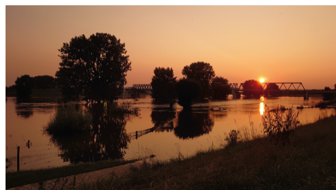
3e prijs, Sandra Drinkwater, hoogwater