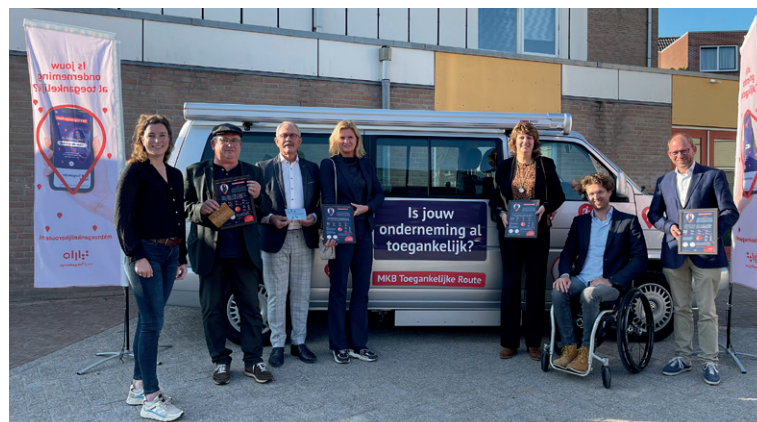
Wethouders van de 4 gemeenten bij de uitreiking van de certificaten.

Ondernemers kunnen ook gebruik maken van de gratis e-training: 'Een gastrijke ontvangst voor iedereen in het Rijk van Nijmegen', te vinden op www.regioambassadeurs.nl . Deze training biedt inzichten, tools en tips over het omgaan met gasten die net een andere benadering wensen.