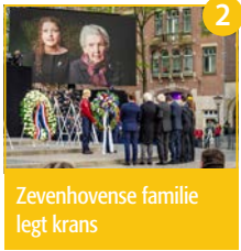
2 Zevenhovense familie legt krans