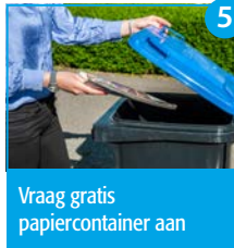
5 Vraag gratis papiercontainer aan