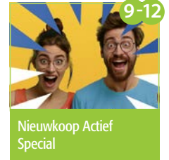
9-12 Nieuwkoop Actief Special