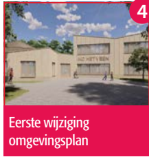
4 Eerste wijziging omgevingsplan