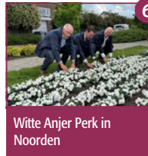
6 Witte Anjer Perk in Noorden