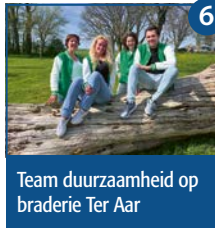
6 Team duurzaamheid op braderie Ter Aar