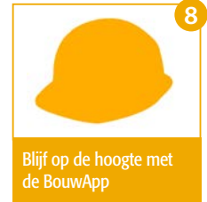
8 Blijf op de hoogte met de BouwApp