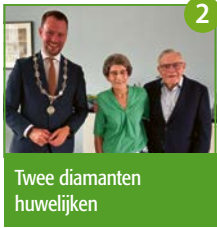
2 Twee diamanten huwelijken