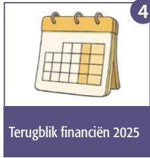
4 Terugblik financiën 2025