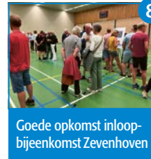
8 Goede opkomst inloop- bijeenkomst Zevenhoven