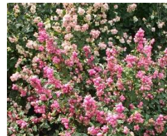
Symphoricarpos Pink Blizzard (sneeuwbes) Bloemen: roze, augustus-sept. Hoogte: tot 1 meter Bevordert biodiversiteit