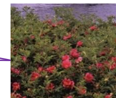
Rosa 'Short Track' (heesterroos) Kleur bloemen: Rood Hoogte: tot 0,5 meter Bevordert biodiversiteit