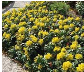
Mahonia Blackfoot (mahoniestruik, wintergroen) Bloemen: goudgeel, april-mei Hoogte: tot 0,6 meter