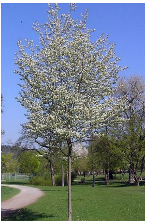
Amelanchier arborea 'Robin Hill' (krenteboompje) Kroonvorm: smal piramidaal Hoogte: tot 6 meter Bevordert biodiversiteit