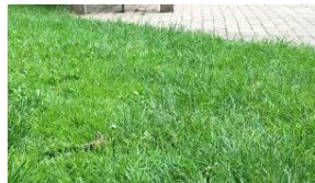
Gazon hoge sier- of gebruikswaarde