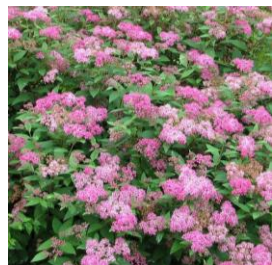
Spiraea japonica 'Anthony Waterer' (spierstruik) Bloemen: rozerood, juni - september Hoogte: tot 0,6 meter Bevordert biodiversiteit