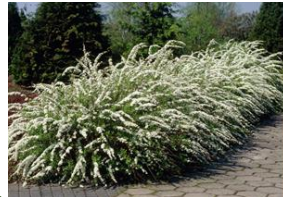
Spiraea nipponica Snow Cover (spierstruik, iets overhangende twijgen) Bloemen: wit, mei - juni Hoogte: tot 0,75 meter Bevordert biodiversiteit