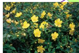
Hypericum dem. 'Peter Dummer' (hertshooi) Bloemen: heldergeel, juni - sept. Hoogte: tot 0,5 meter Bevordert biodiversiteit