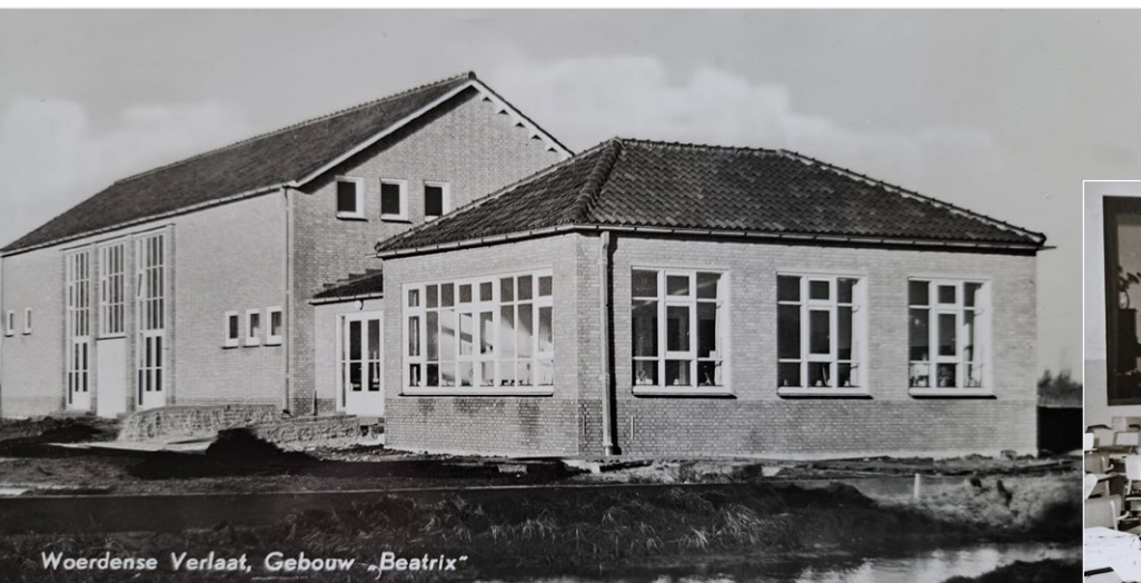
Woerdense Verlaat, Gebouw „Beatrix“