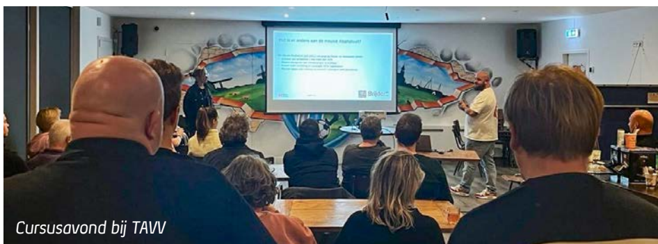
Cursusavond bij TAVV

Heeft u de training gemist? De IVA-cursus is altijd online te volgen. Deze vorm is natuurlijk niet zo interactief als een avond zelf. Daarom willen we in oktober de cursus nog een keer in onze gemeente organiseren. Heeft u interesse, meld u zich dan aan via het Sportpunt van de gemeente via sportpunt@nieuwkoop.nl .