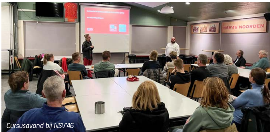
Cursusavond bij NSV'46

In totaal 44 vrijwilligers van verenigingen uit onze gemeente hebben tijdens twee cursusavonden hun certificaat Verantwoord Alcohol Schenken behaald.