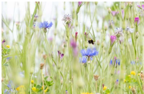
2 e prijs: Monique Klein-Schiphorst 'Bijenparadijs'.