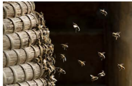
3 e prijs: Sven Rodenburg 'Van bloem tot honing'.