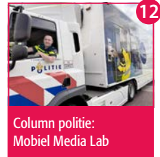
12 Column politie: Mobiel Media Lab