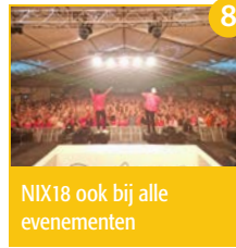
8 NIX18 ook bij alle evenementen