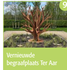
9 Vernieuwde begraafplaats Ter Aar