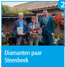
2 Diamanten paar Steenbeek