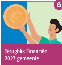
6 Terugblik Financiën 2023 gemeente