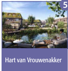
5 Hart van Vrouwenakker