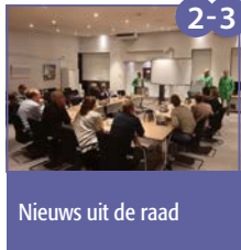
Nieuws uit de raad