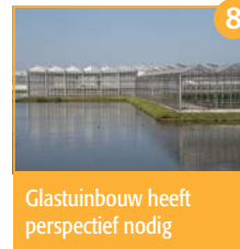
Glastuinbouw heeft perspectief nodig