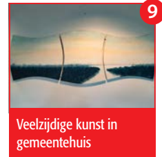
Veelzijdige kunst in gemeentehuis