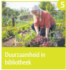
Duurzaamheid in bibliotheek