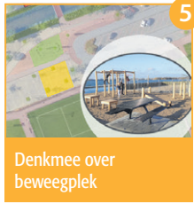
Denk mee over beweegplek