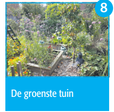
De groenste tuin