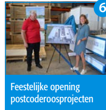
6 Feestelijke opening postcoderoosprojecten