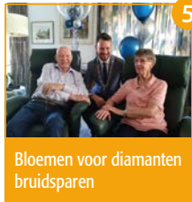
5 Bloemen voor diamanten bruidsparen