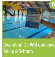
6 Zwembad De Wel opnieuw Veilig & Schoon