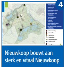
4 Nieuwkoop bouwt aan sterk en vitaal Nieuwkoop