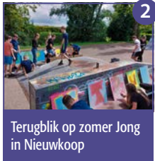
2 Terugblik op zomer Jong in Nieuwkoop