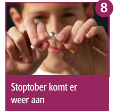
8 Stoptober komt er weer aan