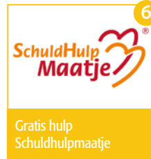
Gratis hulp Schuldhulpmaatje