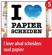
I love afval scheiden: oud papier