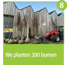
We planten 200 bomen