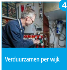
Verduurzamen per wijk