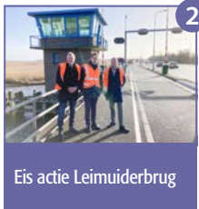
Eis actie Leimuiderbrug