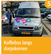
5 Koffiebus langs dorpskernen