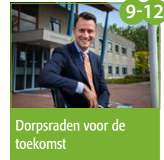
9-12 Dorpsraden voor de toekomst