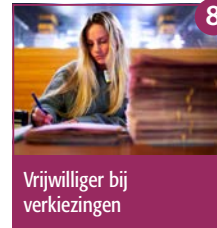
8 Vrijwilliger bij verkiezingen