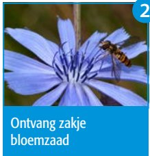
2 Ontvang zakje bloemzaad