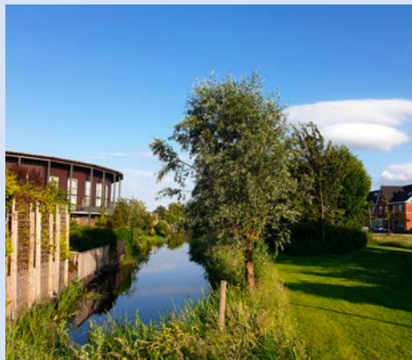
Aalscholverlaan en Blaarkop

Sinds 2016 is Dorpsraad Het Vosje er voor de dorpen Ter Aar en Korteraar. Wij zetten ons in voor het gezamenlijk belang van de dorpsbewoners. Ideeën, wensen en behoeften die inwoners hebben gedeeld, zijn opgenomen in een Dorpsplan. Dat plan is de basis voor ons werk en groeit met de tijd mee.