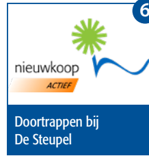
6 Doortrappen bij De Steupel