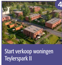
4 Start verkoop woningen Teylerspark II