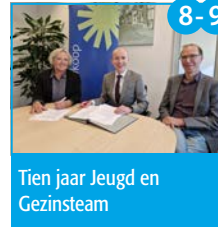
8-9 Tien jaar Jeugd en Gezinsteam