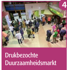
4 Drukbezochte Duurzaamheidsmarkt