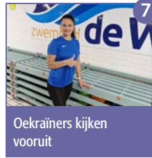
7 Oekraïners kijken vooruit