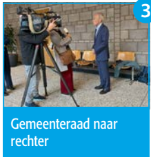
3 Gemeenteraad naar rechter