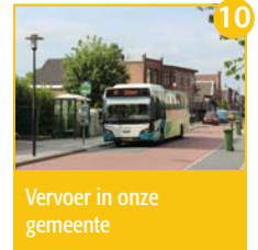
10 Vervoer in onze gemeente