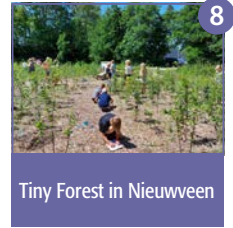
Tiny Forest in Nieuwveen