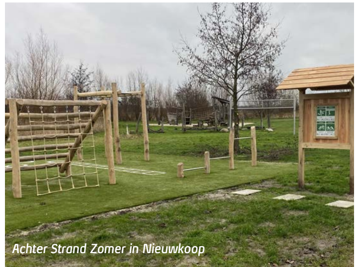
Achter Strand Zomer in Nieuwkoop

Alle speel- en sporttoestellen beheren en onderhouden we. Hoe we dit doen staat in het 'Beleids- en beheerplan spelen'. Elke vijf jaar maken we een nieuw plan. In januari 2025 gaan we aan de slag met een nieuw plan voor 2026 tot en