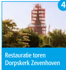
Restauratie toren Dorpskerk Zevenhoven