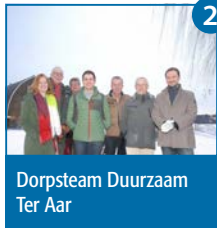
Dorpsteam Duurzaam Ter Aar