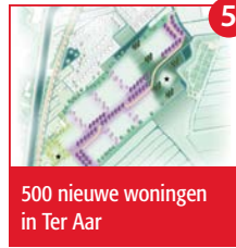
500 nieuwe woningen in Ter Aar