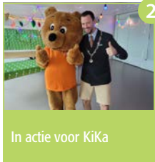
In actie voor KiKa