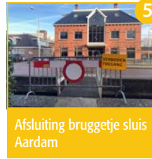
Afsluiting bruggetje sluis Aardam