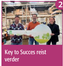
2 Key to Succes reist verder