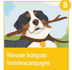
8 Nieuwe hotspots hondencampagne