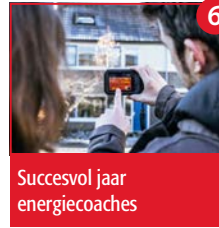
6 Succesvol jaar energiecoaches