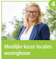
4 Moeilijke keuze locatie woningbouw