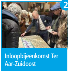
2 Inloopbijeenkomst Ter Aar-Zuidoost