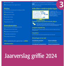
3 Jaarverslag griffie 2024