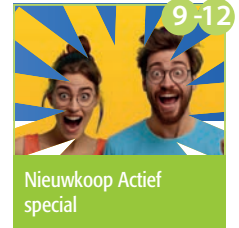
9-12 Nieuwkoop Actief special