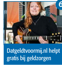
6 Datgeldvoormij.nl helpt gratis bij geldzorgen