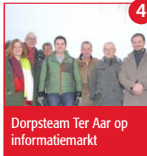
4 Dorpsteam Ter Aar op informatiemarkt