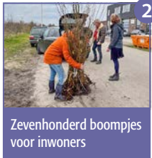
2 Zevenhonderd boompjes voor inwoners