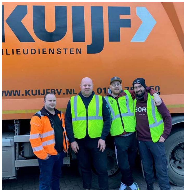
Een deel van de vrijwilligers van TAVV dat oud papier ophaalt.