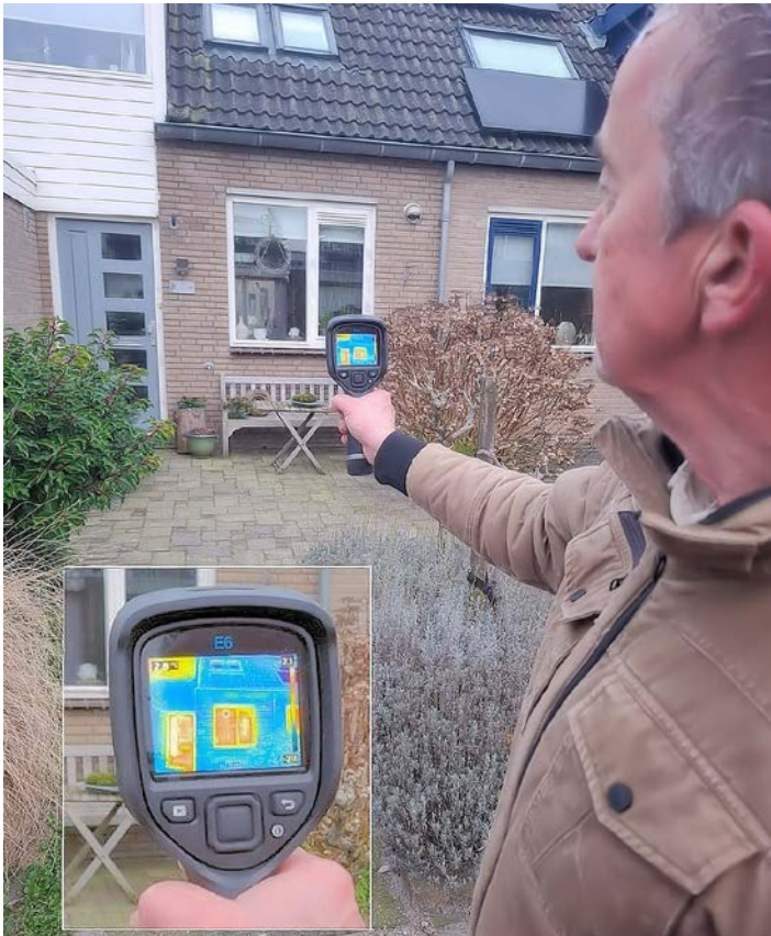
Meting met een warmtebeeldcamera van een woning in de Walnootstraat.

Dorpsteam Duurzaam Ter Aar helpt inwoners van Ter Aar op weg bij energie besparen en verduurzamen. Woensdag 19 maart organiseert zij een informatiemarkt van 19.30 tot 21.00 uur in IKC De Vaart.