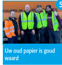
5 Uw oud papier is goud waard