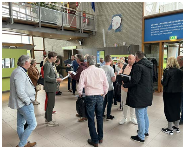
Op 13 juni is een petitie over de Zierendeweg aan de raad aangeboden

Voorafgaand was een juridisch advies gevraagd aan de huisadvocaat over de kans van slagen. Tijdens de raadsvergadering is de voorgenomen motie niet ingediend. Samen Beter Nieuwkoop en SGP-ChristenUnie maakten de inschatting dat met meer informatie de motie meer kans zou maken. Het kan zijn dat zij de motie alsnog indienen tijdens de volgende besluitvormende raad van 4 juli nadat zijzelf contact hebben gelegd met onder andere de gemeenteraad van Alphen aan den Rijn.