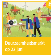
Duurzaamheidsmarkt op 22 juni