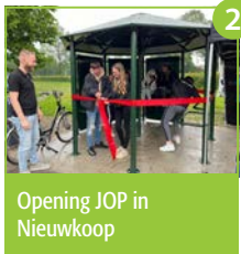
Opening JOP in Nieuwkoop