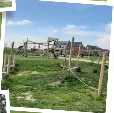
Argonnepark | Ter Aar