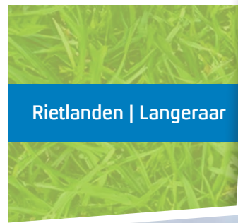
Rietlanden | Langeraar