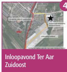
Inloopavond Ter Aar Zuidoost