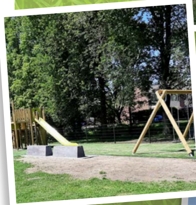
Meerkoet | Noorden