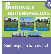
Buitenspelen kan overal