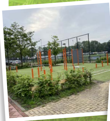
Zudde | Nieuwkoop