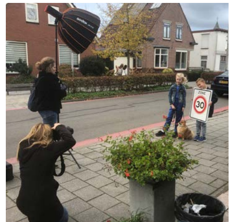
De fotoshoots voor de verkeerscampagne gedragsverandering zitten erop. Twaalf kinderen, een moeder, het lieve hondje Foxy en drie senioren uit onze gemeente zijn, met hun mooiste glimlach, op de foto gezet in Ter Aar, Noorden en Nieuwkoop. De foto's staan eind november/begin december op grote borden langs de weg in de drie kernen om de verkeersdeelnemers te vragen zich aan de snelheid te houden.

er veel aandacht voor biodiversiteit en duurzaamheid. Er wordt gebruik gemaakt van houtbouw, de fietsenberging krijgt een groen dak en op de daken van de appartementen komen zonnepanelen. Ook komt er een gezamenlijke tuin voor de bewoners van de appartementen en voor evangelische gemeente De Brug. Dit project biedt een mooie start voor Nieuwkoopse jongeren op de woningmarkt." Na het plaatsen van de wand konden toekomstige bewoners alvast met elkaar kennismaken en de bouwplaats bekijken. Naar verwachting worden de appartementen in het eerste kwartaal met mogelijke uitloop naar het begin van het tweede kwartaal van 2023 opgeleverd. We wensen Vink Bouw een voorspoedige bouw en de toekomstige bewoners veel woonplezier.