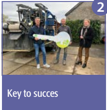
Key to succes