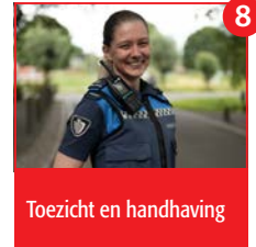
Toezicht en handhaving