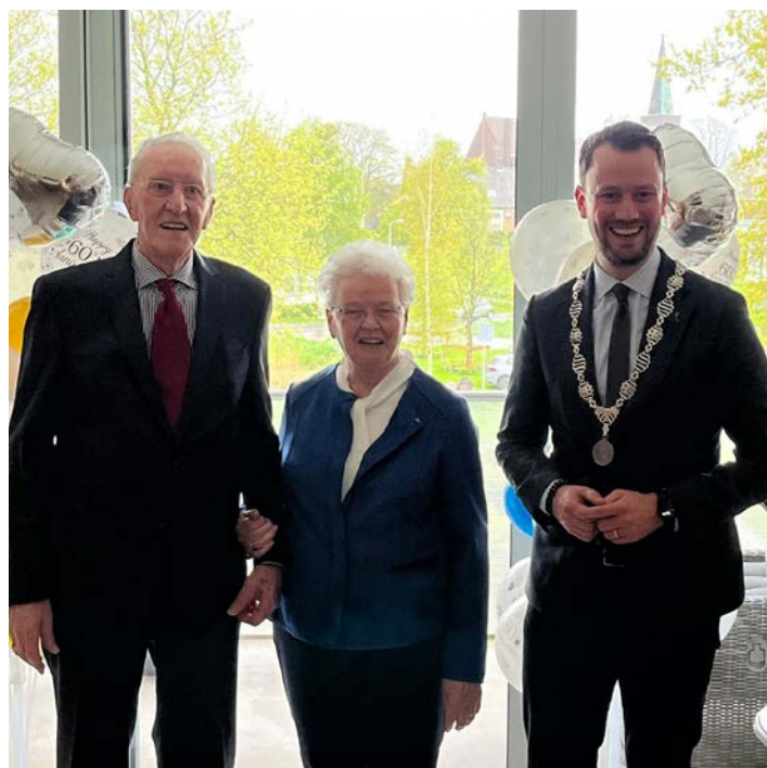
Bridsparen, van harte gefeliciteerd en nog vele fijne jaren samen.

De burgemeester bezocht het diamanten bruidspaar thuis in Nieuwkoop. Hij overhandigde een boeket bloemen en een kopie van de originele trouwakte.