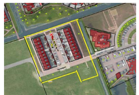
Langeraar, Baljuwstraat grasveld