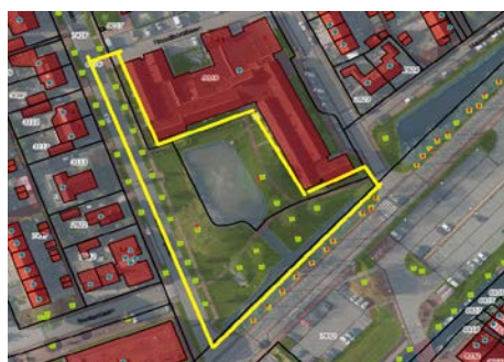
Nieuwveen, Teylerspark rondom de woningen