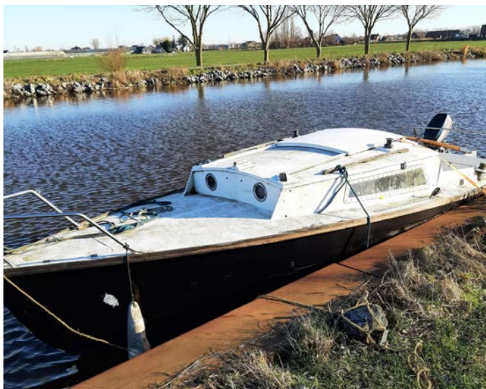
De boot in Ringsloot Nieuwkoop.