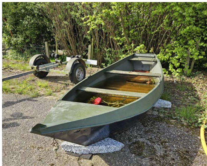
De boot in de Drecht in Bilderdam.

Ons Team Handhaving zoekt de eigenaren van twee boten. De eerste boot ligt in de Drecht bij Bilderdam.