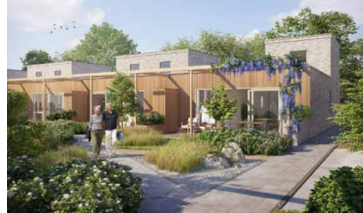
Dit zijn impressies, hieraan kunnen geen rechten worden ontleend